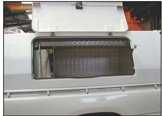
Werkzeugkasten und Regale