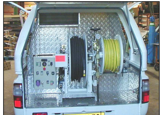
Hydraulische HDschlauchtrommel Aufnahme von 80 m 3/8" Schlauch Füllschlauchtrommel