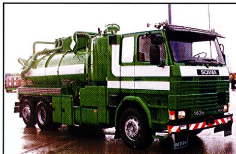
Kombi 10 m 3 Wasserringpumpe 2760 m 3 /h HD Pumpe 84 Liter/min bei 130 bar