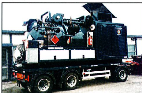
9 m 3 Sauganlage auf Abrollrahmen Wasserringpumpe 3000 m 3 /h HD Pumpe 84 Liter/min bei 130 bar