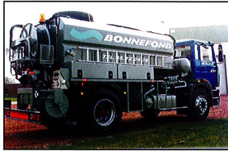
Hochdruck-Spülanlage 8 m 3 HD Pumpe 335 Liter/min bei 170 bar