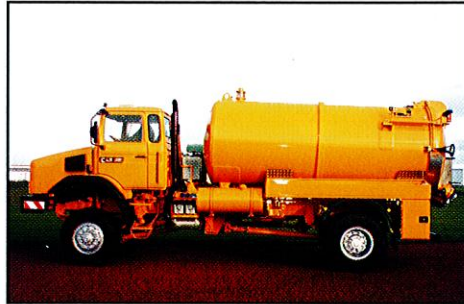
10 m 3 Sauger Vakuumpumpe 750 m 3 /h