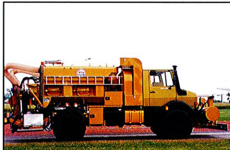
Flüsterasphalt- u. Bodenreini- gungs- Maschine mit Was- serrückgewinnung Turbine 22.000 m 3 /h HD Pumpe 73 Liter/min bei 370 bar